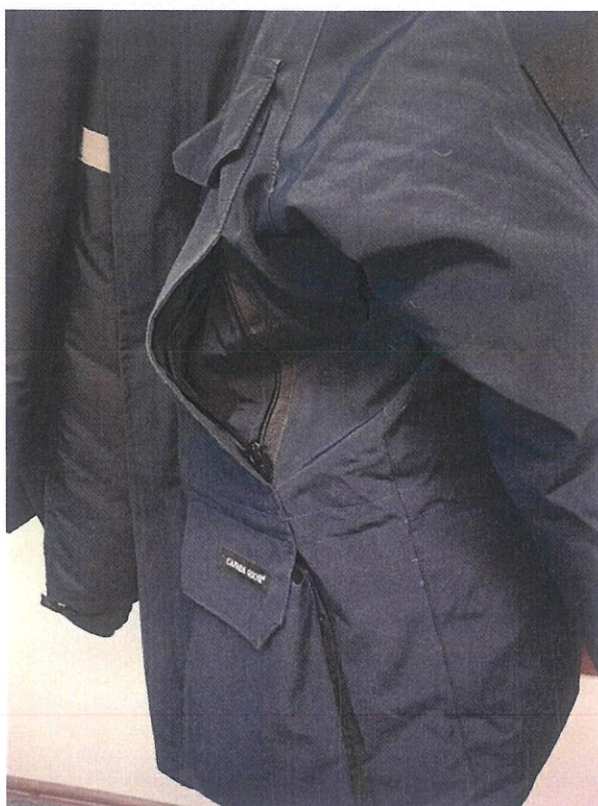
Рисунок 4. Карман сбоку