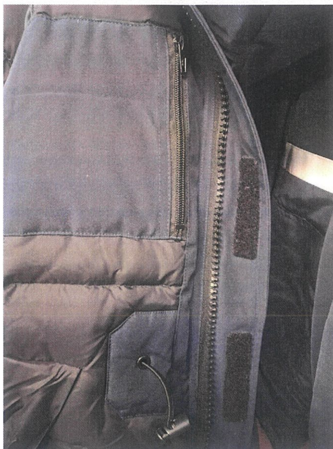
Рисунок 5. Внутренний карман с обеих сторон куртки