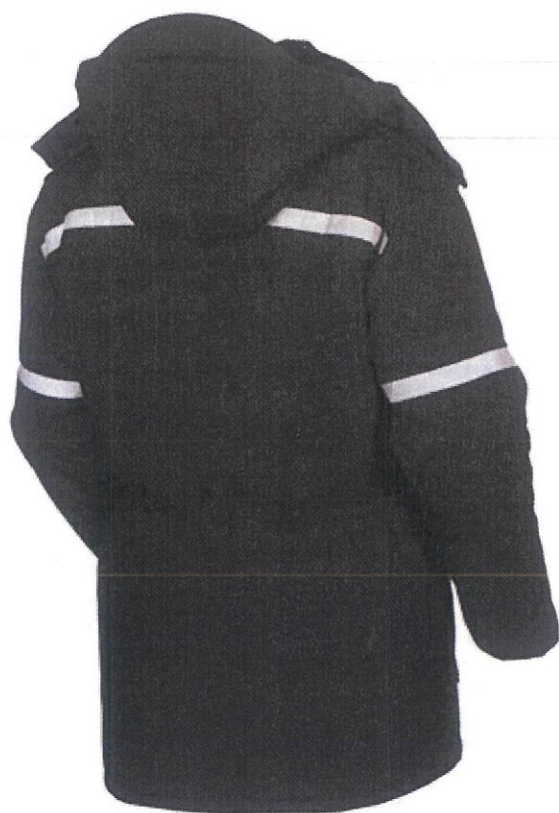
Рисунок 3. Вид сзади и отражающие элементы