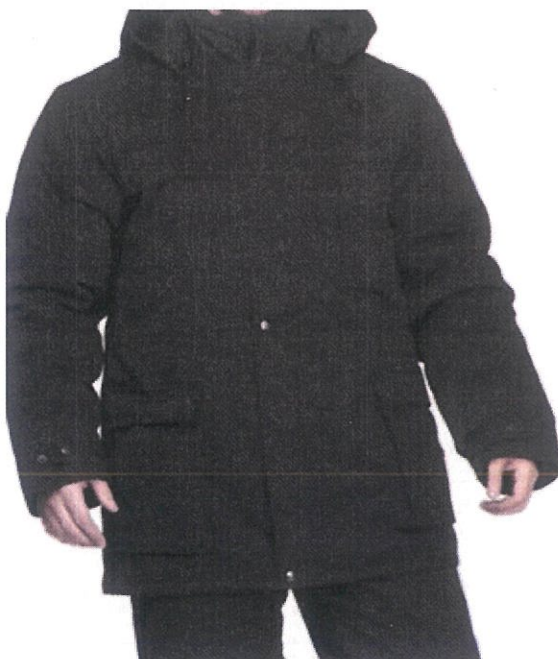
Рисунок 1. Куртка вид спереди