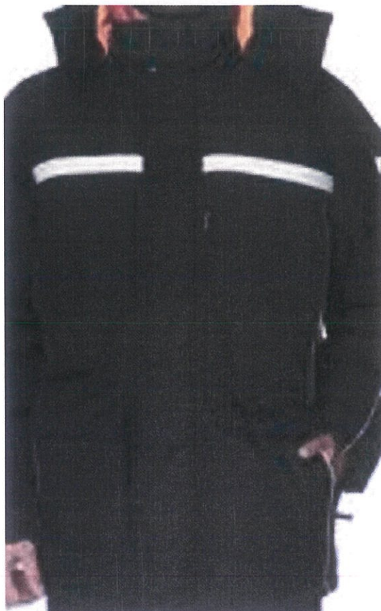
Рисунок 2. Отражающие элементы спереди